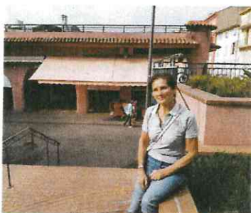
Rosette Gasperoni, qui a immortalisé la scène.